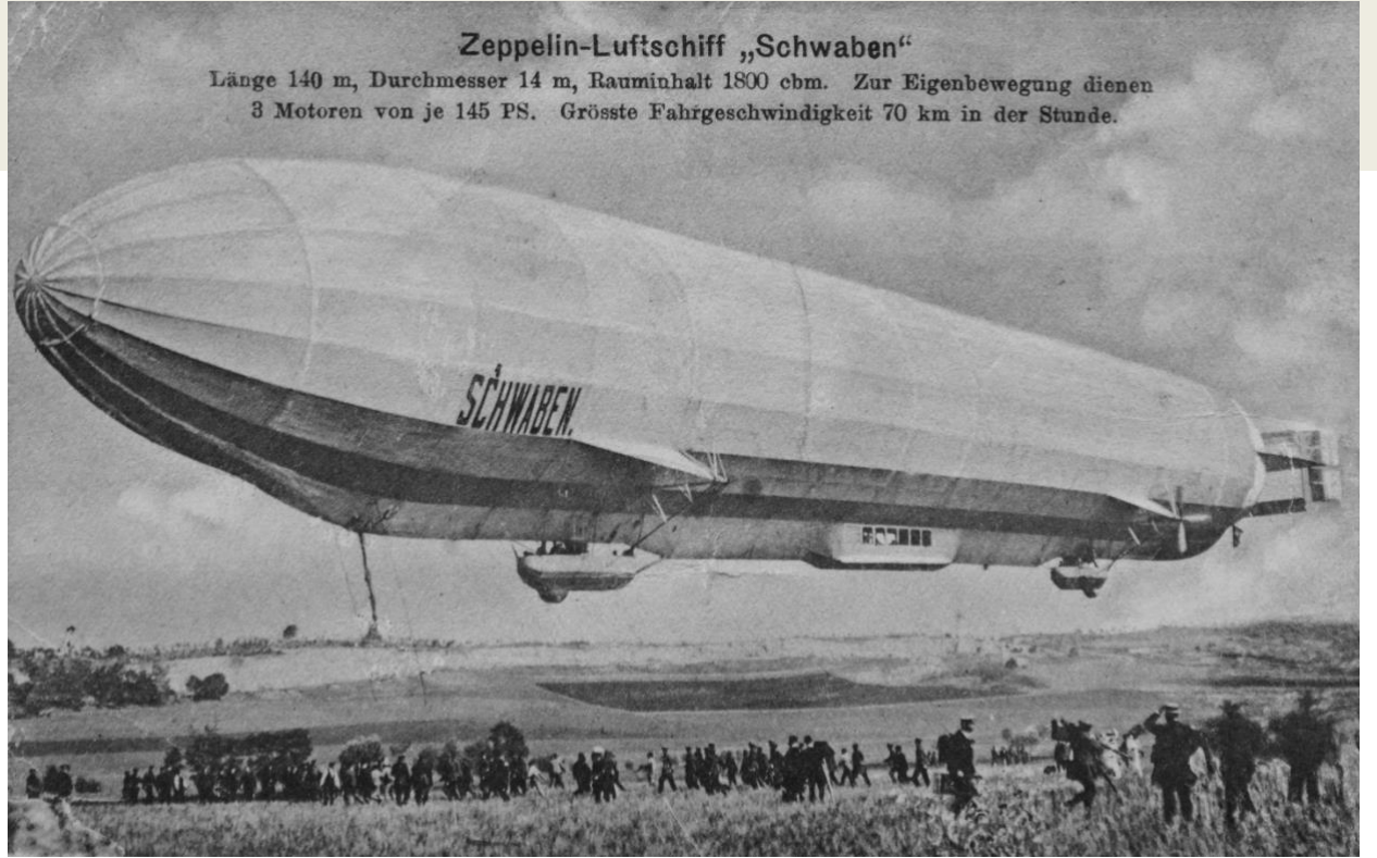
Die Möglichkeit zu fliegen, ein Traum von jedem Wesen. Erfüllen sie sich diesen Traum mit einem Rundflug.