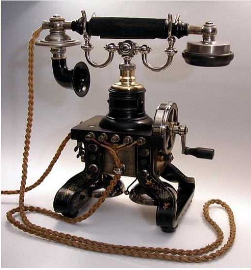
Das Kommunikationsmittel der Zukunft (Telefonapparat)