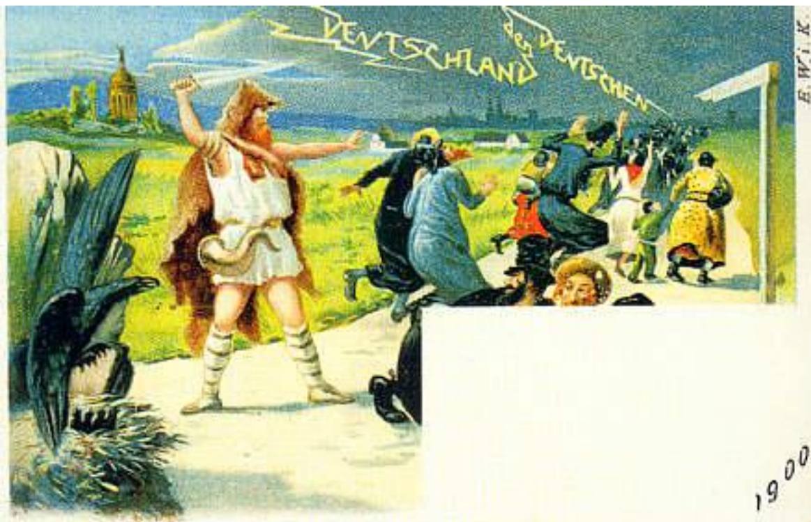
2 Mark, erhältlich bei Schindlers Zeitungsstand

„Gehrter Herr Pfarrer! Da ich mich aus dem Judengewimmel in der Stadt in obriges Lokal geflüchtet habe, um in Ruhe einen Pilsner zu schlürfen, gedenke ich Ihrer und sende die besten Grüße.“